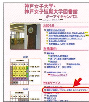
ポートアイランドキャンパス図書館ホームページ