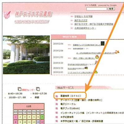
須磨キャンパス図書館ホームページ