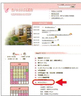
須磨キャンパス図書館ホームページ